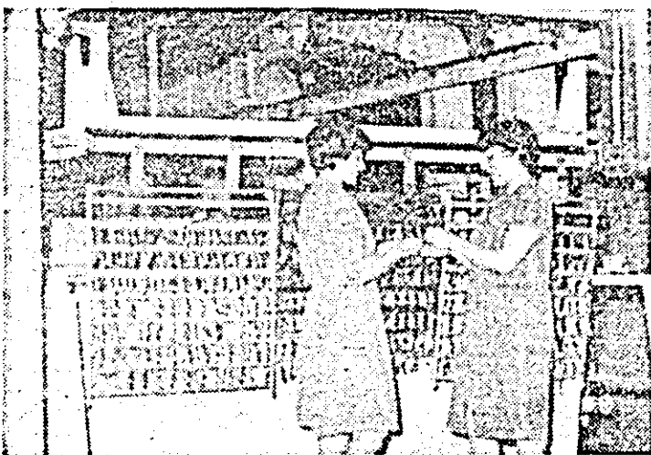
Linia automată de galvanizare de la întreprinderea de articole metalice pentru mobilă și binate. Se verifică calitatea galvanizării.