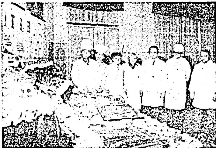
Aspect din expoziția de preparate culinare organizată recent la restaurantul cu autoservire din B-dul Republicii nr. 84.