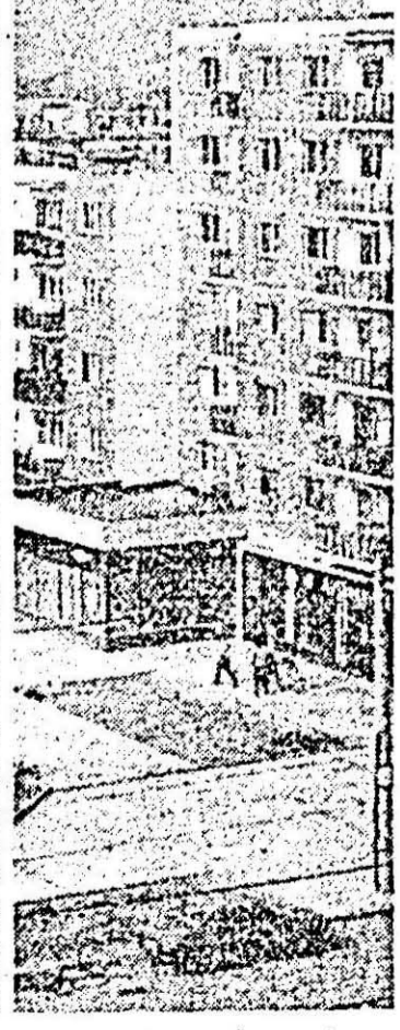
Micălăca. Imagine nouă într-un vechi cartier ară- dean.