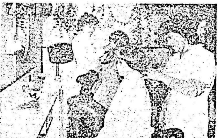
Aspect din unitatea de frizerie „Prichindel” pentru copii.

• Și, tot din comerț, dar de data aceasta numai de bine — „Argusul” „vînzînd” și așa ceva și nu oricum ci cu bucurie. Un cititor laudă mo- dul frumos cum se poartă cu bătrînul — cumpărătorii, sofa de unitate de la Alimen- țarea nr. 111 (strada Mără- șesti), ca și ordinea, curățe- nia și sollicitudinea la „unita- tea de alături (nr. 73). Cîste- lor, zice semnatarul scrisorii. De acord, zicem și noi.