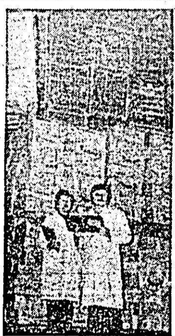
Aspect din depozitul produse finite al I.P.L.F. „Refacerea”.