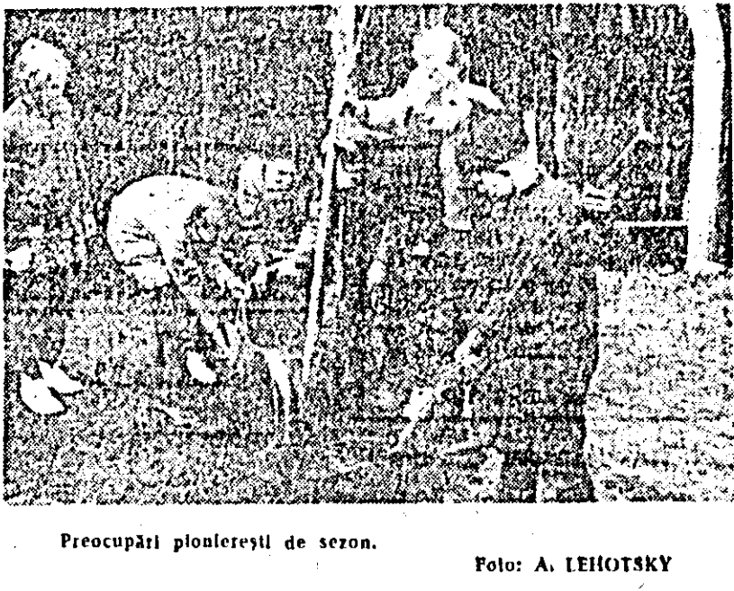
Preocupări pionieresti de sezon.

Asist. la Universitatea populară a municipiului Arad se deschide cursul de astronomie, prima lecție fiind „Astronomie și obiectul ei”. Deschiderea are loc la ora 18.30, la sediul Universității, din B-dul Republicii 78. Se mai pot face încă înscrieri.