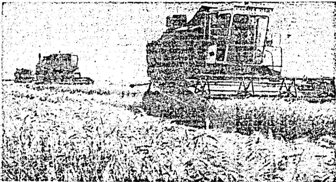
În lanurile auriu de aurul spicelor, combinele au pornit să adune recolta de orz '86.