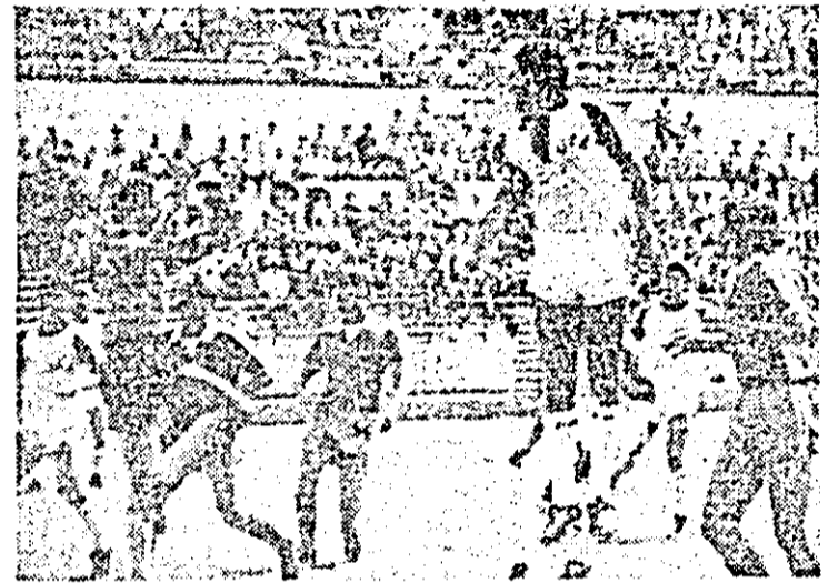
Fază din meciul UTA — Unirea Alba Iulia.

În asemenea condiții, cu un plus de dorință și de angajare colectivă, oaspeții au fructificat o fază de atac prin Rus, care — din interiorul câmpului arădean și căm ne-