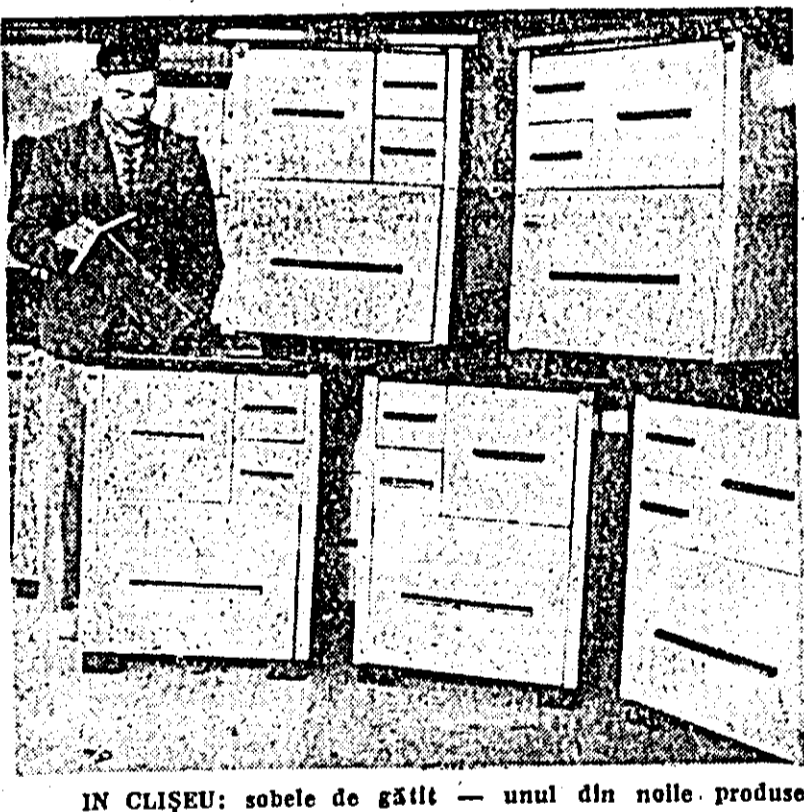
IN CLIȘEU: sobele de gătit — unul din noulle produse de la IOIL „Electrometal”.

Fabrica de mase plastice din Buzău produce acum pe scară industrială spume de poliorură de vinil, elastice și dure. Ea livrează în mod curent uzinei „Tudor Vladimirescu” din București spume elastice pentru tapizarea autobuzelor, iar altor unități pentru tapetierii.