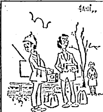
— Numai să găsim mai repede „amatori de chilipiruri” că de apare miliția sau păgubașii, nu știa pe unde scoatem cămașa...