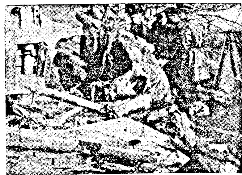
Action german doborit in liniile franceze

coastă. Cauza reală n'a fost deci decât o eroare de navigație. Eroarea nu constituie un motiv legal ce ar fi autorizat submarinul să pătrundă în apele norvegiene. Aceste fapte fiind în mod indiscutabil dovedite, ordine au fost date ca întreg echipajul să fie dezarmat și submarinul să fie internat. Ordinele au și fost executate Joi dimineața, de către un contratorpilor norvegian.