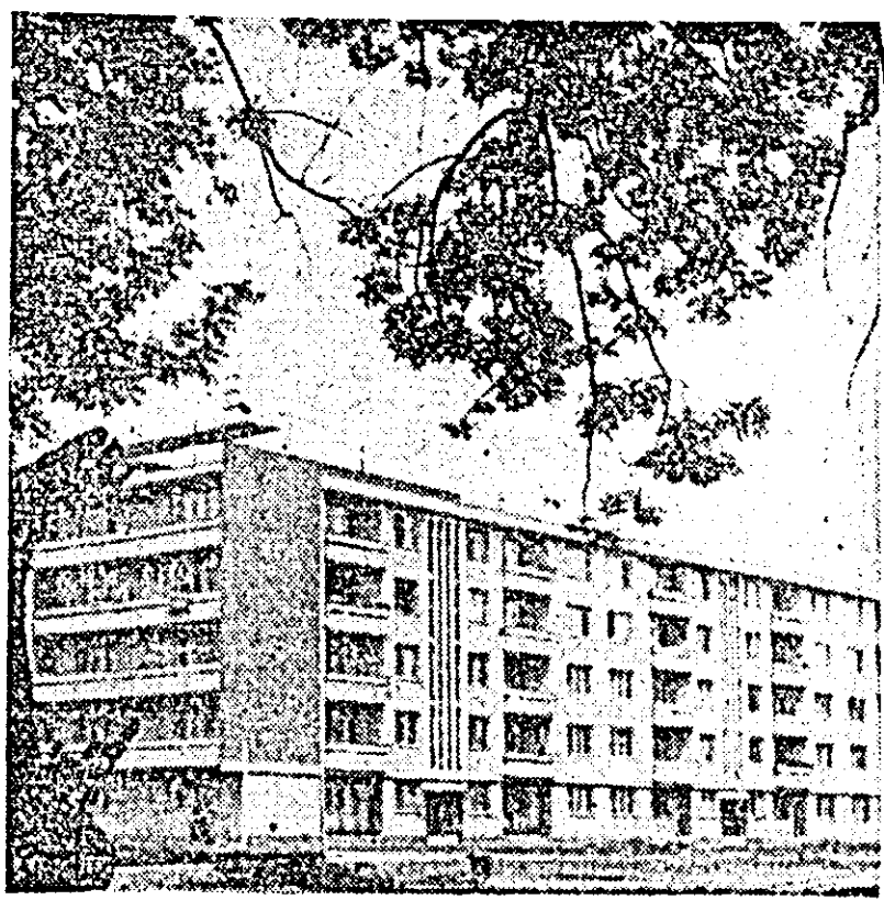
Din noul peisaj al Aradului. Aspect din cvartalul Podgoria

Pentru a obține a eficiență economică și rezultate calitative și mai bune, constructorii de vagoane utilizează turnarea în cochilă metalică a pieselor din oțel combinată cu metoda de injecție a miezurilor cu bioxid de carbon.