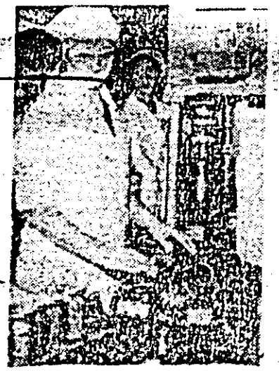
La întreprinderea „Relacearea” se folosesc din plin capacitățile de producție în scopul valorificării recoltei de legume.