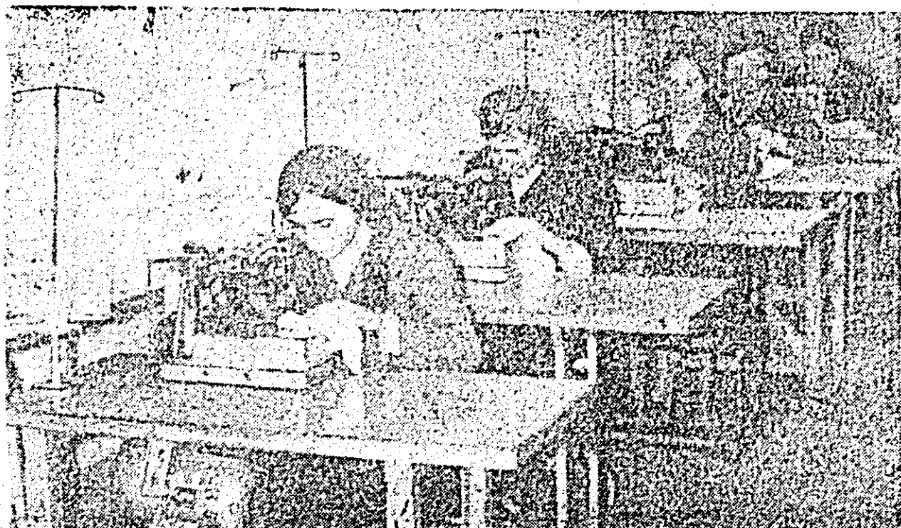
In atelierul de trefcotej al Școlii profesionale textile, tinerele elevs, sub îndrumarea atentă a maeștrilor, își însușesc tălănele meseriei.