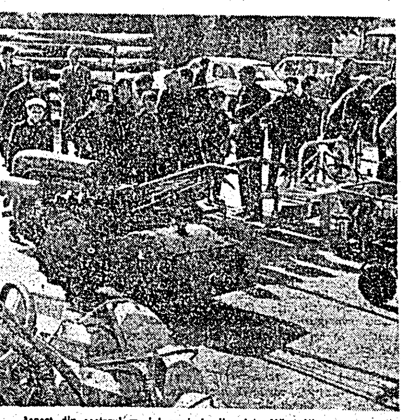
Aspect din sectorul mașinilor agricole din piața Mihai Viteazu.