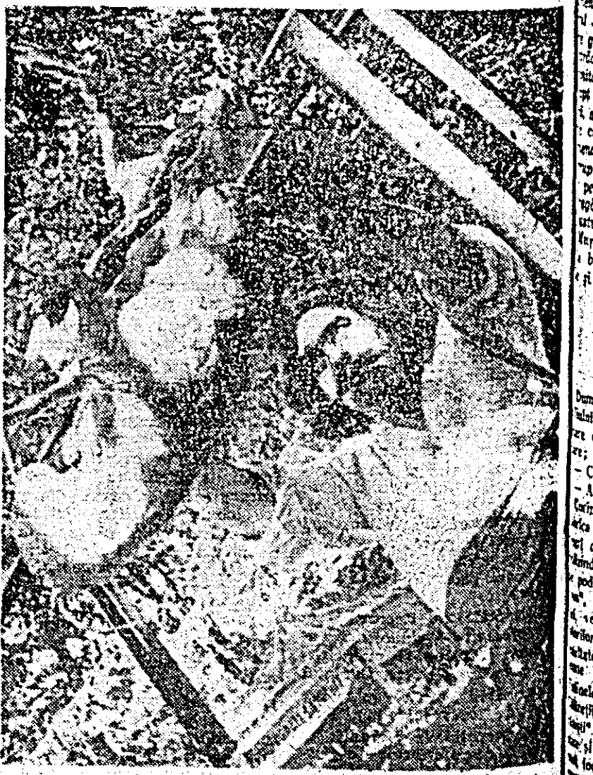
Purcelul rumenit a constituit un punct de atracție pentru țărâni.