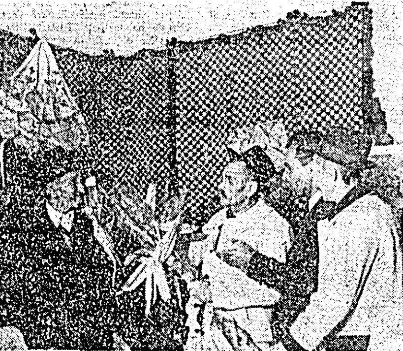
Cooperativorii din Vărădia de Mureș și inginerul lor analizează rezultatele acestor ani și pe cele ce le vor obține în viitor.