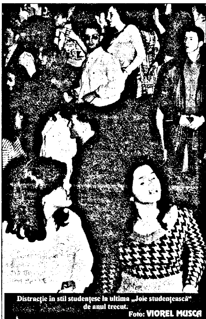
Distracție în stil studentesc la ultima „Joie studentească” de anul trecut.