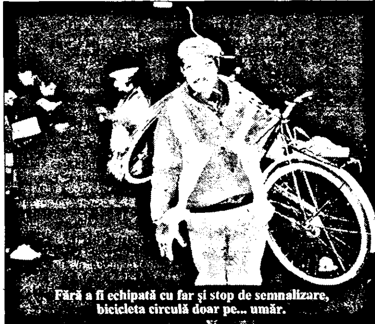
Fără a fi echipată cu far și stop de semnalizare, bicicleta circulă doar pe... umăr.