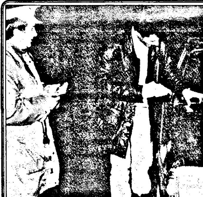
Suspans! Permisul de conducere e de negăsit... Și totuși...