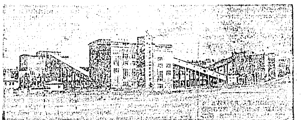
Fabrica de Imbunatațire a calitatii cărbunului din Dimitrovo.

(1948—1952). La sfîrșitul celui de-al doilea cîncinal, Bulgaria a încetat importarea de pro- duse farmaceutice și a început chiar să exporte asemenea pro- duse. S-a lărgit deosebit de mult producția de antibiotice. O parte însemnată a antibioti- celor produse se exportă. Nu- mai în primul semestru al a- nului curent au fost exportate în Albania 500.000 fiolecoane de penicilină, iar la sfîrșitul anu- lului vor fi exportate în R. D. Vietnam patru milioane de flo- coane. Cresce neîncetat producția fa- briilor de produse chimico-far- macaceutice și a fabricii de in- strumente medicale din Sofia. In prezent, in Bulgaria, se fa- brică peste 800 de tipuri de medicamente și peste 500 ti- puri de instrumente și aparate medicale, se produce piramidon, analgin, remifon, insulină, adrenalină, cortin și alte medi- camente de calitate superioară. In anii celui de-al treilea cînci- nal (1958—1962) volumul pro- ducției industriei de medica- mente și de aparate medicale va crește cu 335 la sută față de cîncinaiul precedent.