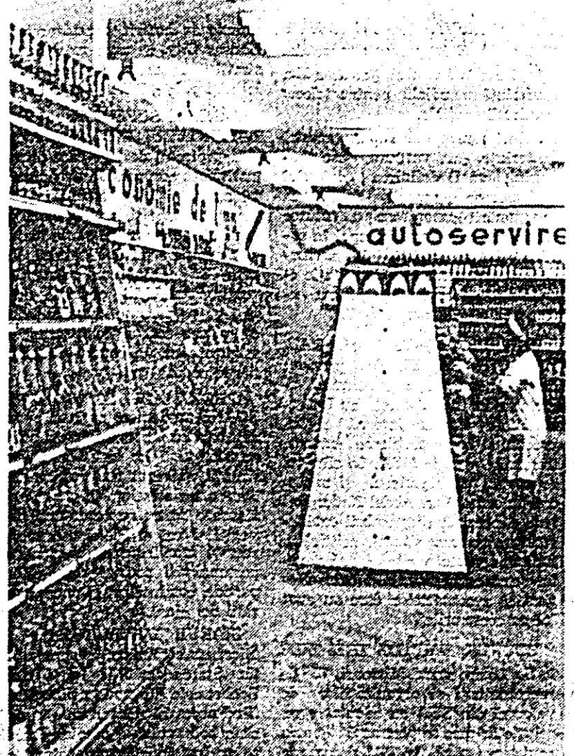
Un nou magazin alimentar cu autoservire îmbogățește spațiul de desfacere comercială a municipiului nostru. Magazinul cu autoservire din Piața Gării.

Locul din sectoarele aducătoare de însemnate venituri bănești de la cooperativa agricolă din Aluniș, este cel legumicol. În acest an, de exemplu, legumicultura s-a extins pe o suprafață de 50 ha. Din gama sortimentelor ponderea o dețin tomatele în cîmp și soarelui, ceapa și ardei. Convingîndu-se din proprie experiență că numai prin efectuarea la timp și de calitate complex de lucrări agrotehnice se pot obține producții sporite, cooperatorii s-au străduit să facă manual toate prașile și stropirile planificate. Drept urmare culturile se prezintă deosebit de viguroase și bine dezvoltate, iar la unele, bunăoară la tomate și ardei a început recoltatul. De remarcă că pe o suprafață de 0,50 ha teren în trecut neproductiv, s-au cultivat ardei, goșogari nabi de pe care se prevede a se obține un venit suplimentar în valoare de peste 35.000 lei.