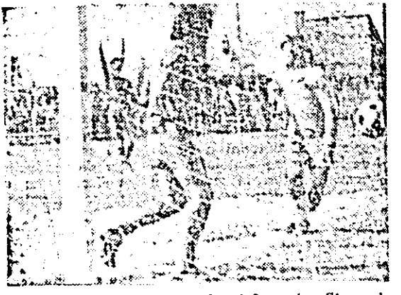
Baliga sutează plasat și... 1-0 pentru Strungul.

rămîne însă nemodificat, deoarece Mihuț (min. 48), Kato (min. 56) și Roth (min. 57) ratează ocazii bune. Ținînd cont de aspectul general al întîlnirii, arădenii au cîștigat pe merit. Chiar dacă au neglijat latura spectaculară a întîlnirii, ei ni s-au părut mai decîși și au dominat majoritatea timpului. În această confruntare, cel mai bun jucător de la Strungul ni s-a părut fundașul central Roth.