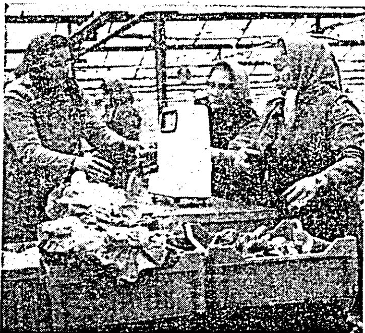
În serile termale din Sintana a A.E.C.S. Sere Arad se recoltează salata verde.