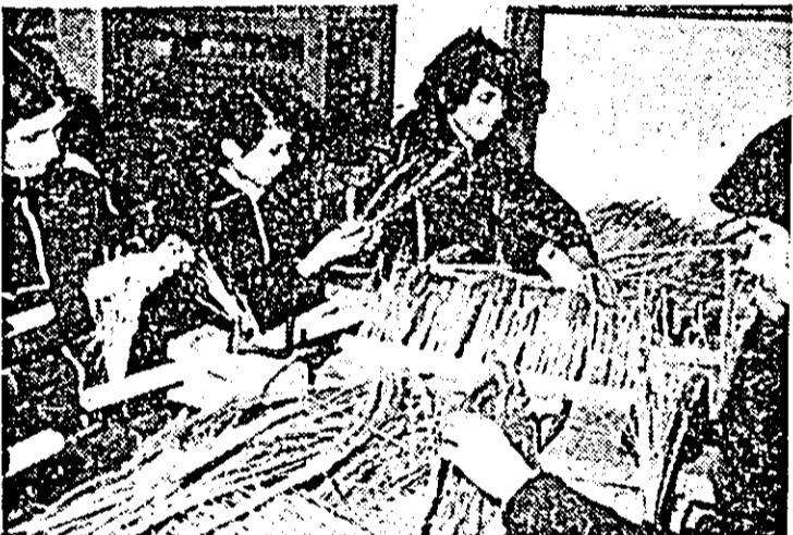
In mai puțin de două luni, elevii Școlii generale Pincota, realizînd în cadrul orelor de activități practice comenzi de perii de sorg pentru C.P.L. au adus școlii un venit de peste 5.000 lei. IN IMAGINE: elevii clasei a VIII-a A lucrînd la realizarea acestor produse.

Miercuri, 11 martie 20 Informațiile zilei. 20.10 Actualitatea în industrie. 20.20 Cîntăcile „Savoii” și „Queen”. 20.30 Partidul arhitect al prezantului socialist. Emisiune monografică — Cent; Timiș. 21—21.30 Emisiune literară. Joi, 12 martie 6—7 Radioprogram matinal.