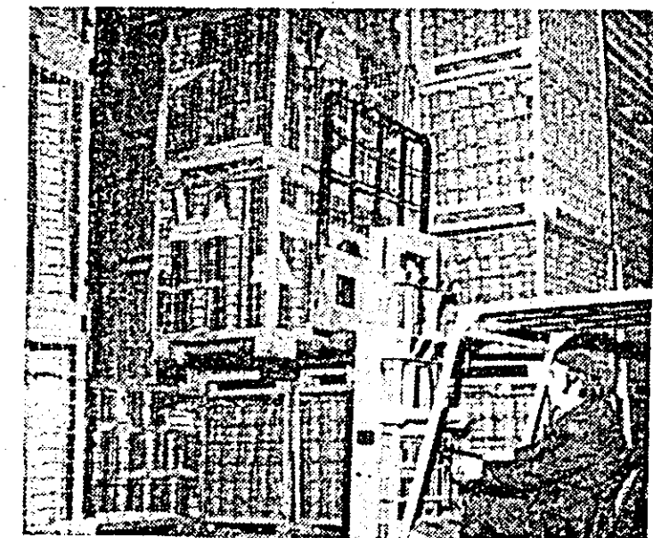
Aspect din magazia de produse finite a întreprinderii de producere și industrializare a legumelor și fructelor „Refacerea” Arad.

Rezultatele, după cite se poate constata, sînt bune. Cu ce eforturi au fost obținute? În primul și în primul rînd, ca urmare a unei masive „investiții” de inițiativă și spirit gospodăresc. Căci, altfel, ar fi imposibil de explicat faptul că numai 31 de