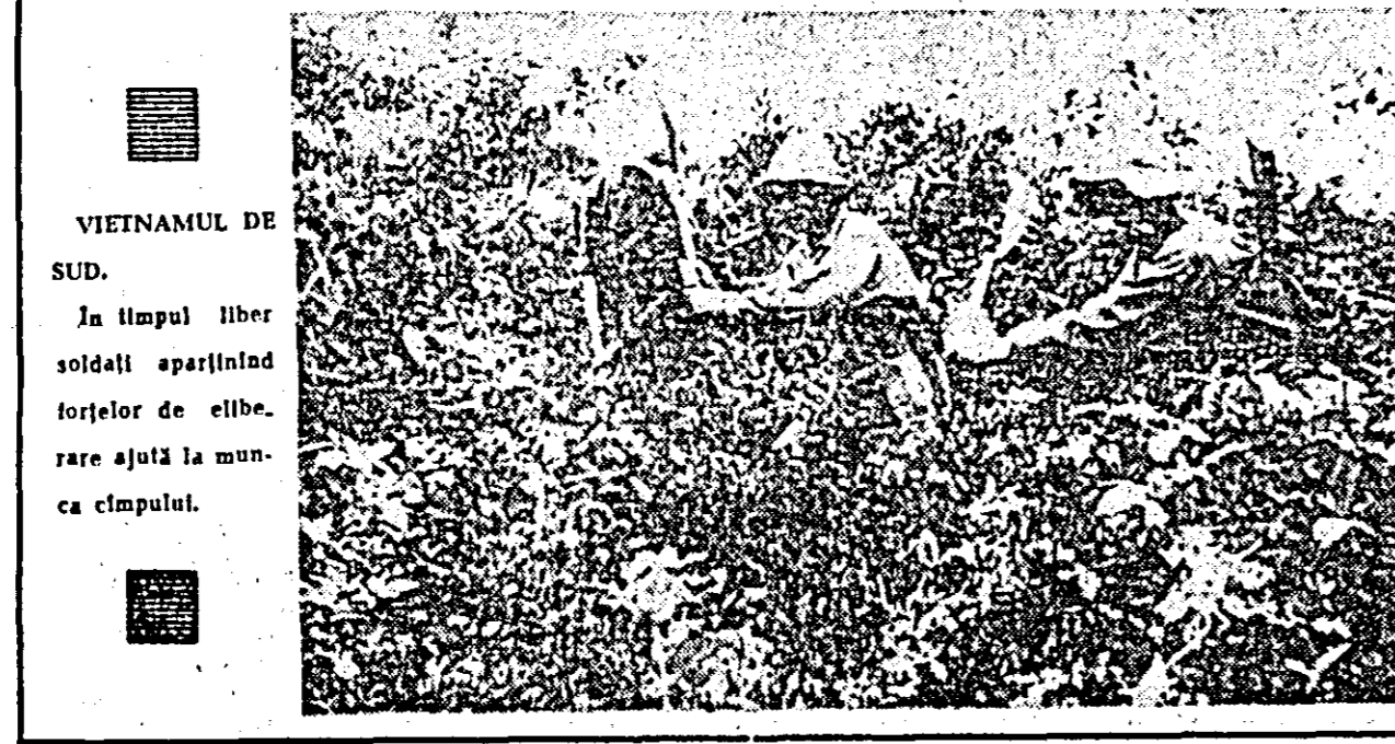
VIETNAMUL DE SUD. În timpul liber soldații aparținând trupelor de eliberare ajută la muncă timpului.

WASHINGTON 14 (Agerpres). — Senatul american a pus la dispoziția presei stenogrammele audierilor din Comisia pentru serviciile armatei, consacrate implicării CIA în luptele din Laos, la care au compărut ministrul apărării, Melvin Laird, și ambasadorul SUA la Vientiane Mc Murtrie Goldy. Cu noul prilej, se arată în stenograma, Laird a informat pe senatori că „guvernul SUA cheltuiește suma de 490 milioane dolari anual în operațiunile din Laos, care includ și întreținerea unei armate de aproximativ 30000 de militari specializați în luptele de guerrilă, recrutați și finanțați direct de Agenția Centrală de Investigatii (CIA)”. Ambasadorul american în Laos a declarat, la rândul său, că recrutații pentru unitățile de mercenari laotieni au început în toamna anului 1962. Goldy a precizat că în rândurile agențiilor CIA din Laos activează foști militari americani. Menționează că ambasadorul american supervizează activitățile militare în Laos, inclusiv activitatea unităților secrete de guerrilă, create de CIA, a determinat pe subsecretarul de stat, Alexis Johnson, să caracterizeze această ca „fără precedent”. Nicu o dată înainte, a spus Alexis Johnson, Statele Unite nu au lăsat în seama unui ambasador, asupra căruia Departamentul de Stat nu are nici un control operațional, supervizarea operațiilor lor militare dintr-o țară străină.