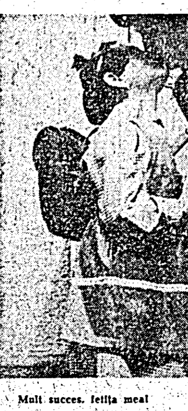
Mulți succes, fetița mea!

Urmărind să răspundă nevoilor diversificate ale societății noastre și învățămîntului cunoaște un proces de diversificare. Cît de util pentru societate ca și pentru tineri este acest proces, ne-o dovedește numărul mare de candidați prezenți la examenul de admitere în aceste școli care le oferă posibilitatea urcării în învățămîntul superior, dar și posibilitatea unei inserții imediate în producție. În anul acesta numărul liceelor de specialitate a crescut cu nu mai puțin de 72 de unități, dintre care, după cum se știe, trei numai la Arad: Liceul de chimie înființat prin transformarea Liceului nr. 5, Liceul pentru industrializarea lemnului și grupul școlar de construcții civile. De o atenție specială se bucură învățămîntul în limbile naționale conlocuitoare. Pe lângă limbile și clasele existente în prezent, se înființează în acest an încă 6 clase în limba maghiară și 3 clase în limba germană. În Arad, adătură de secția în limba maghiară a Liceului Ștefan, a Liceului nr. 3 și a secției germane a Liceului nr. 4, s-au înființat secții cu limba de predare