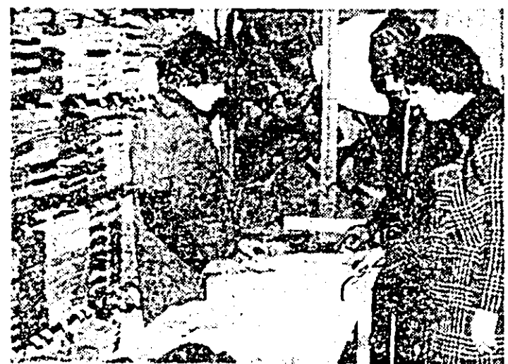
Unitatea nr. 31 a I.C.S. textile-încălțăminte oferă cumpărătorilor un bogat sortiment de sezon.