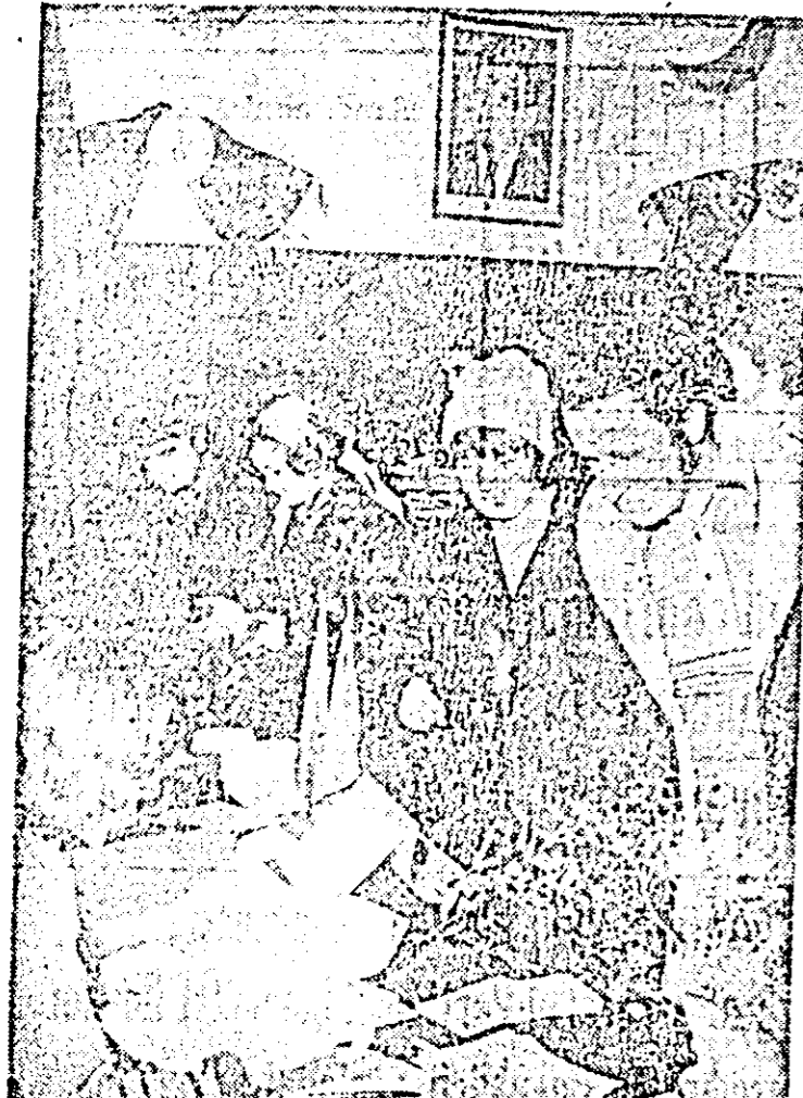
La secția de votare nr. 15 din municipiul Arad.

De la un capăt la altul al județului nostru, de la un capăt la altul al țării s-au prezentat duminică în toate urnele mîltoane și milioane de tîni și femei ale județului și țării pentru a vota candidații Frontului Unității Socialiste — înainta al progresului neceruit, al bunăstării și civilității noastre socialiste.