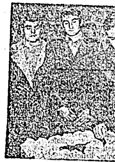
Emoție ferească. Acești tineri elevi de la Liceul Industrial nr. 3 votează pentru prima dată.