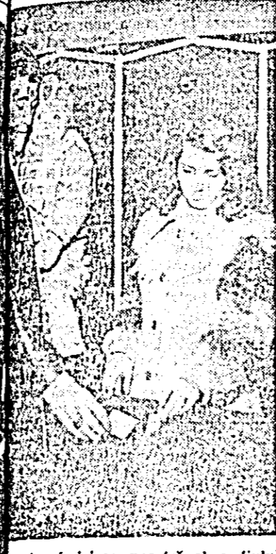
pentru fericirea noastră și a fiului