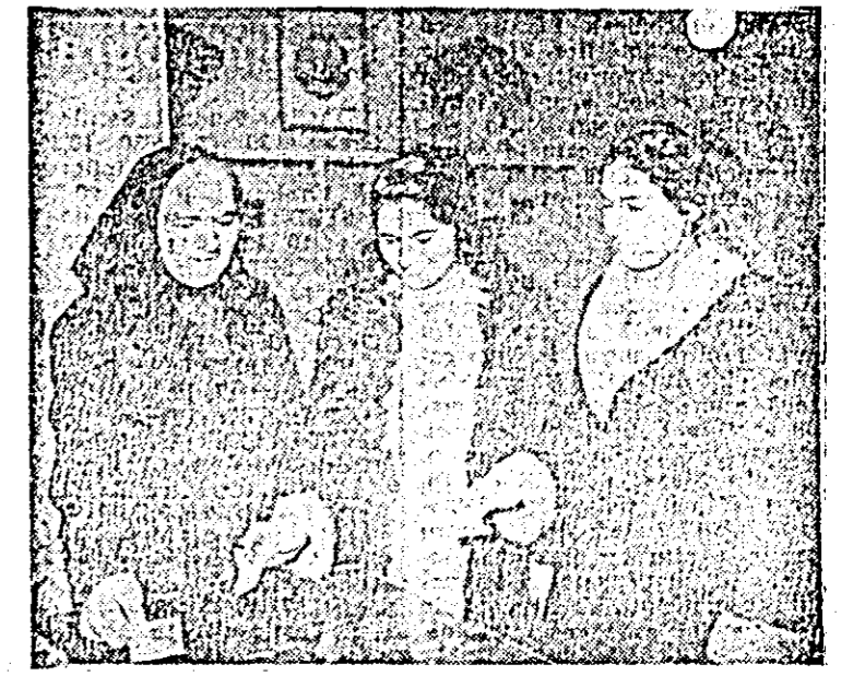
Doză generală — mama și fiicele — în singur giud. „Ne dăm votul pentru o viață tot mai bună“.