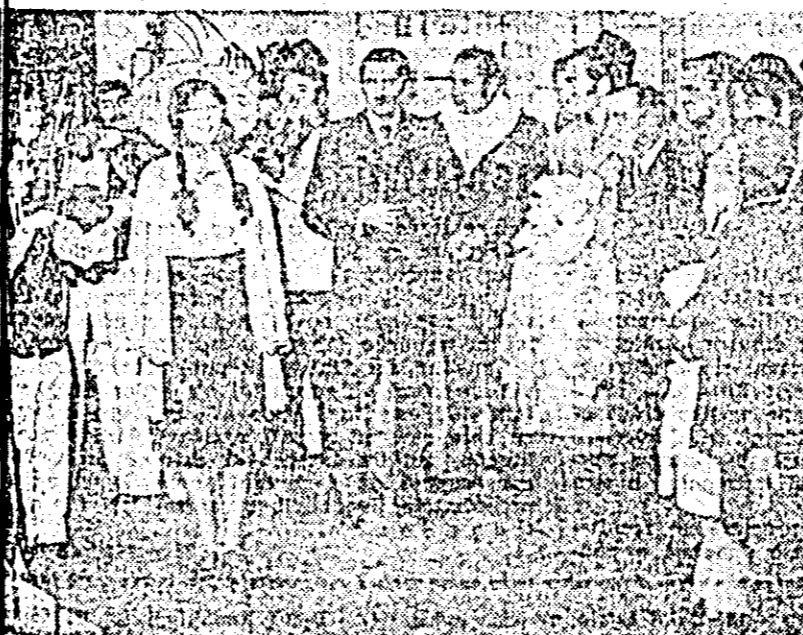
oric la una dintre secțiile de votare din Pecica.