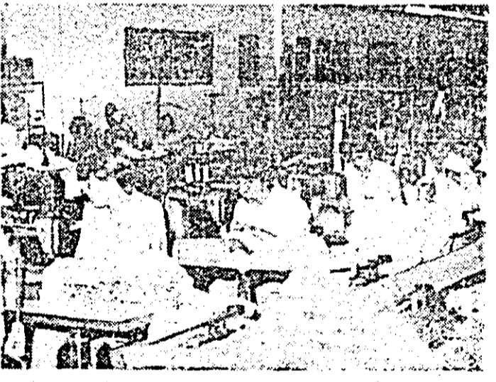
Aspect de muncă în secția confecțiilor a Intreprinderii „Tricolor roșu” Arad.