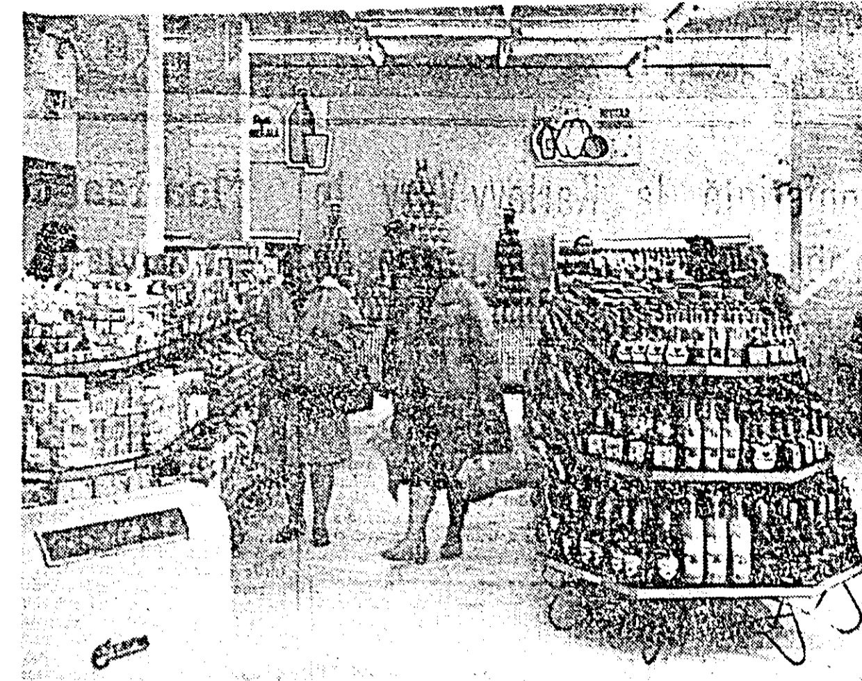
Noul magazin cu autoservire, deschis recent în cvartalul Crișan, dispune de un sortiment bogat de produse. În CLISEU: o secvență obișnuită din interiorul magazinului.