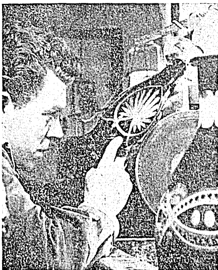
La fabrica de sticlă din Tomești, se lucrează diferite obiecte de o calitate superioară.