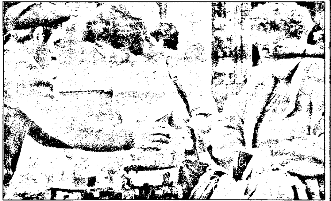
„Cu varza am rezolvat, dar tragedia e că mai trebuie și carne pe lângă ea...”