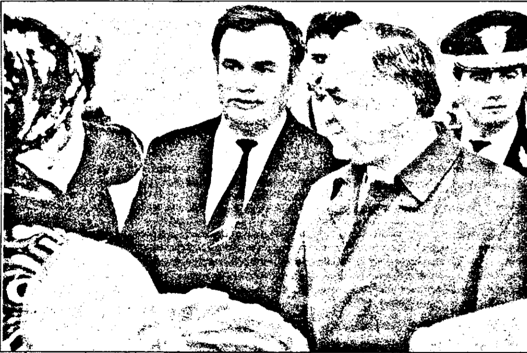
Pe pista aeroportului, după tradiție, cu pâine și sare.