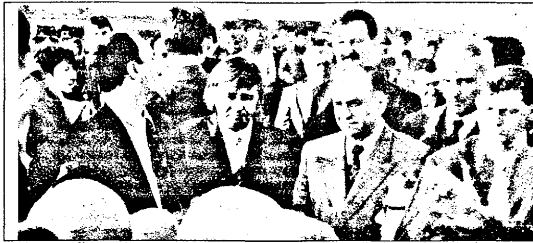
(urmăre din pag. 1)