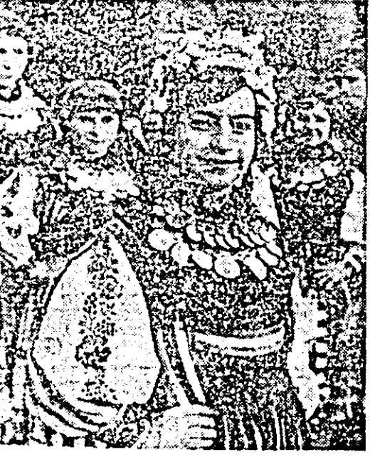
stium popular de Sîcula.