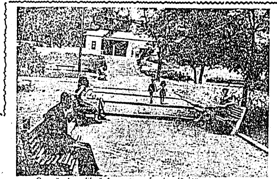
O oră de odihnă în parcu foarte plăcută

rea aici, se numără și faptul că foarte mulți locuitori poartă o grijă deosebită aspectului clădirilor în care locuiesc. Trezînd pe străzi, privirea și se oprește cu multă plăcere asupra a numeroase geamuri împodobite cu gîlste, din care rid cele mai felurite flori. Te încînți în același timp balcoanele și terasele pe care mințile grijului a-e locatarilor le-au împodobit cu ledere, flori și verdeață.