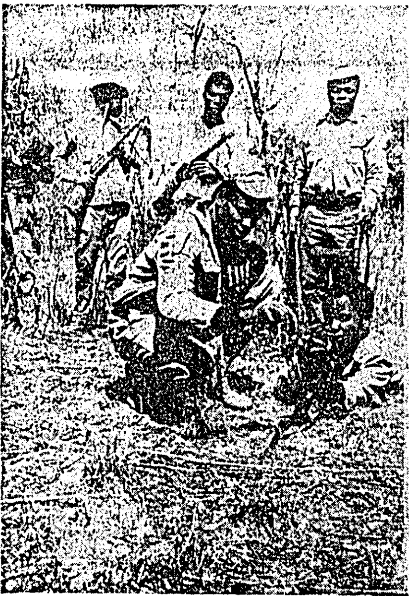
ANGOLA — LUPTA Transformată în colonie portugheză în sec. al XVII-lea, Angola a început să lupte pentru eliberare încă de la începutul sec. XX.