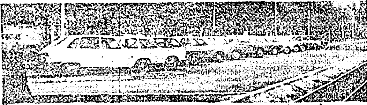
În centrul municipiului — noi spații de parcare.