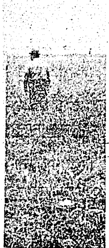
Nerespectîndu-se tehnologiile de lucru, într-o parcelă cu grîu de la C.A.P. Căvășni, au crescut mai mult buruienile...

— Ce-i cu ele? — Sînt defecte, dar, în medie, sapte lucrează în permanent, continuu inginerul șef. Pînă să se execute reglaje la combine, urmăriat într-o