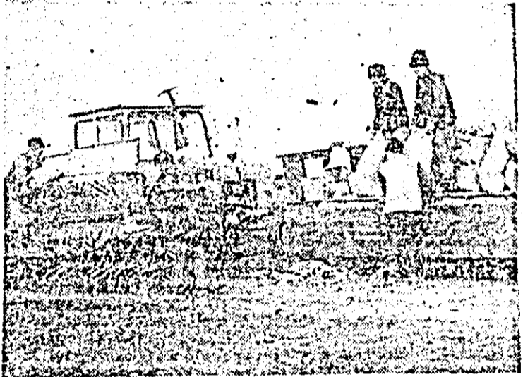
La semănat în unități ale consiliului unității Feliaș.

Ogoarele județului au răscolit și duminică o largă concentrare de forțe la efectuarea lucrărilor din campania de primăvară. Ca urmare, au fost pregătite pentru semănat aproape 1.400 hectare. Tot duminică au fost însămințate peste 800 hectare, din care 125 hectare cu în pentru ulei, 200 ha cu sfeclă de zahăr, 260 ha cu plante de nutreț, 70 ha cu legume, 20 ha cartofi. Cele mai mari suprafețe au fost însămințate în unitățile din C.U.A.S.C. Sintana, Arad și altele. Sub posibilități s-a acționat în cele din Pecica, Nădlac, Cermel, Săvișin, Bellu.