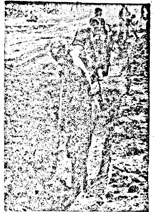
Germanii din Frontul Muncii reface o șosea de pe frontul de Est.