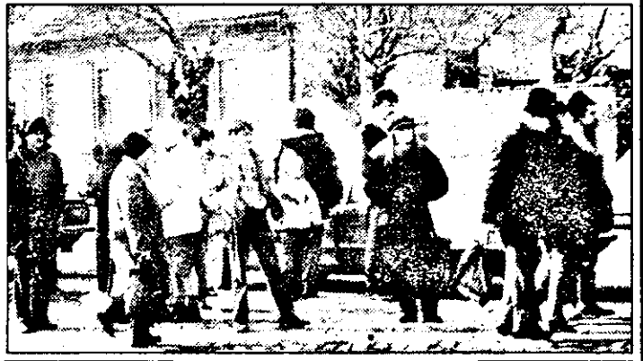
Așteptând, la - 15 grade Celsius un „frigider“ numit... tramvai!