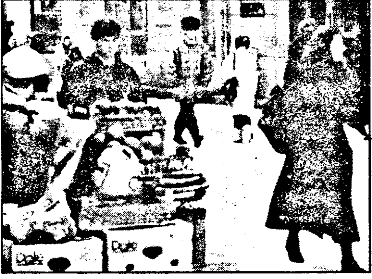
Portocalele sau... indiferența la români.