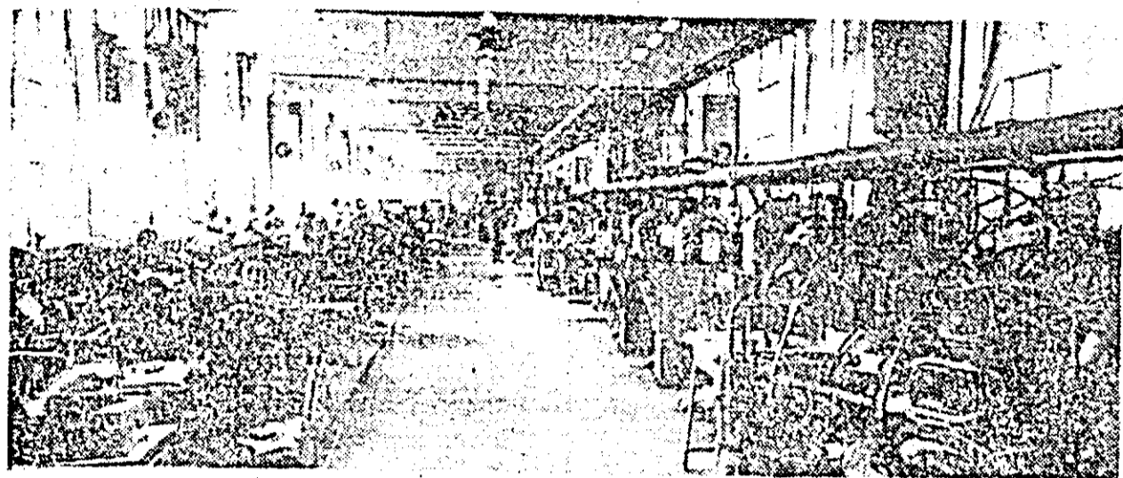
Instantaneu de muncă din hala de cusut și tras fețe a fabricii de încălziminte „Libertatea”.