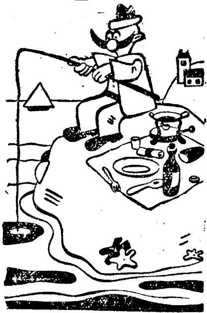
— Kép, szöveg nélkül —