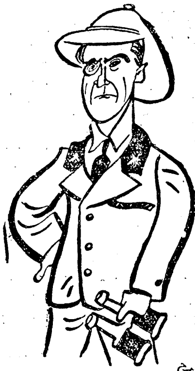
GRAZIANI tábornagy, abesszin alkirály

Addis-Abebából érkezett ujabb jelentések szerint Graziani alkirály, valamint a merénylet többi áldozatainak állapota gyorsan javul. A katonai rendőrség erélyesen folytatja a nyomozást és a merénylet részleteinek felkutatása után a bünösöket késedelem nélkül hadbíroság elé állítják, amely a tárgyalást rövidesen megtartja és az ítéleteket azonnal végrehajtják. A tettesekre halálos ítélet vár. A fascista osztagok tegnap felkutatották a főváros valamennyi negyedét. Addis-Abebában jelenleg 30.000 olasz katona állomásozik.