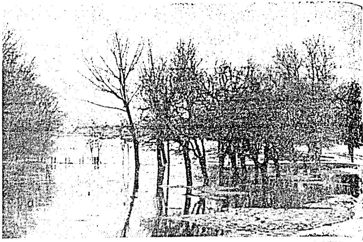
Sfîrșitul iernii