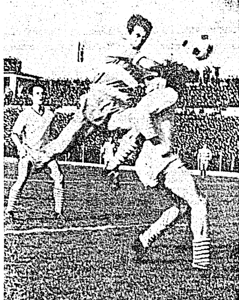
Fază din meciul U.T.A.—U. Craiova.