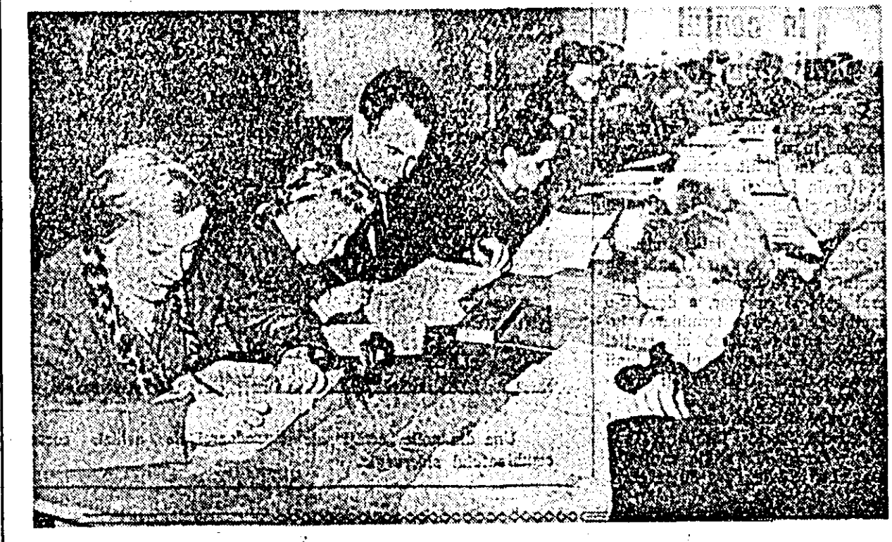
Brigăzile științifice dau răspunsuri la întrebările localnicilor și se vor elucida nedumeririle acestora în unele probleme ale științei și tehnicii.

Printre activitățile clubu-bului „7 Noiembrie” se nu-mără și meditațiile ce se fac aci zilnic cu copii școlari din cartier. Aici, peste 60 de copii își pregătesc lecțiile pentru școală.