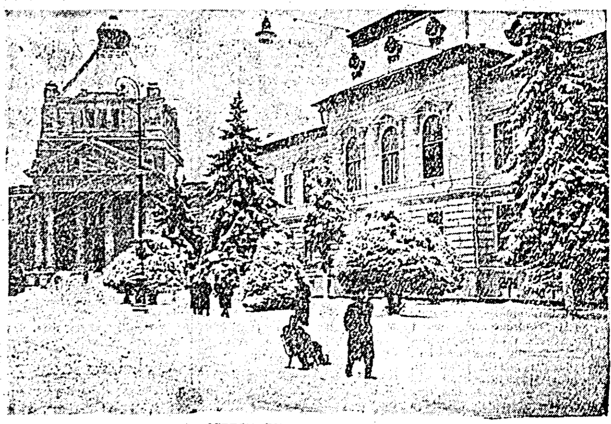
ASPECT DE IARNA ÎN ORAȘUL ARAD.

tineret și studenți din Turcia nu și-au anunțat încă participarea la intîlnirea de la București. Pentru intîlnirea de la București s-a prevăzut un program bogat. Timp de 6 zile participanții vor avea posibilitatea să dezbătă pe larg problemele înscrise pe ordinea de zi: raportul general despre „Contribuția tineretului și studenților din țările regiunii Balcanilor și a Mării Adriatice, precum și a organizațiilor lor la transformarea acestei regiuni într-o zonă a păcii, denuclearizată, pentru lărgirea cooperării, dezvoltarea relațiilor de prietenie dintre tineret și studenți din aceste țări” și documente finale ce vor fi adoptate la intîlnire. Totodată reprezentanții tineretului din țările balcano-adriatice vor avea prilejul să cunoască îndeaproape și să discuta-