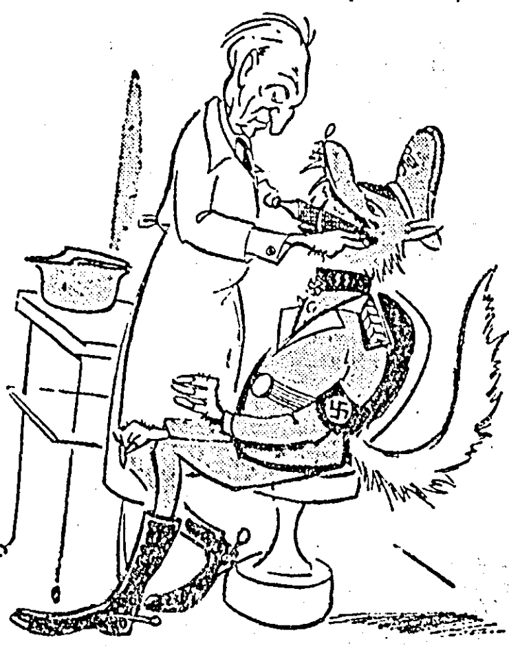
Adenauer (făcînd toaleta militarismului vest-german) — DORIŢI COLŢII MAI ASCUŢIŢII?

R.F.G. Adenauer, a plecat din Berlinul occidental spre Bonn cu un avion special al forţelor ae-