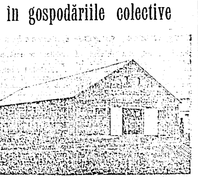
IN OLĂȘEU: noul grajd co se construiește la G.A.C. Șag.