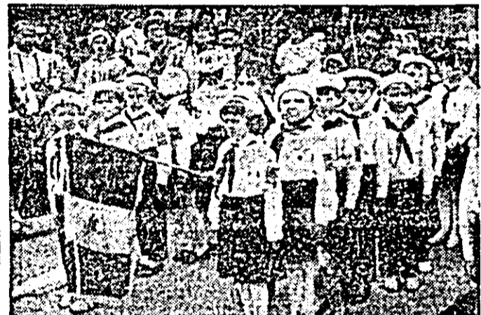
Elevi ai claselor a II-a de la Școala generală nr. 5 Arad, la festivitatea de primire a cravatei roșii cu tricolor.