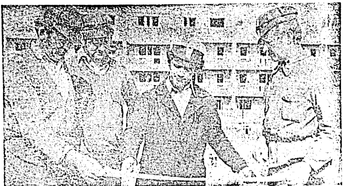
Pe șantierul nr. 3 din zona Pasaj-Micălaca, o discuție cu cîțiva tineri constructori asupra de- tajiilor documentației de execuție.

ELEONORA TOMA: Cred că în acest sens este elocvent și ur- mătorul exemplu: dacă o mașină