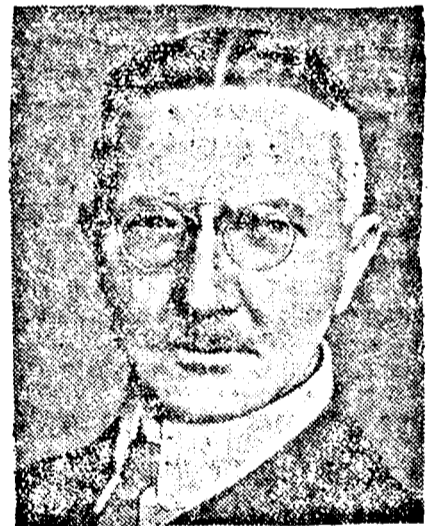
Dr. SCHACHT HJALMAR