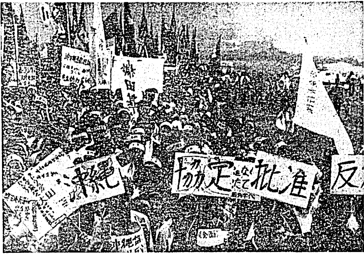
JAPONIA. La începutul lunii octombrie s-a organizat pe scară națională o mare demonstrație de protest împotriva clauzelor tratatului asupra Okinawei, prin care vor fi menținute pe insulă baze militare americane. Demonstrația a avut loc în apropierea bazei militare americane Yokota din Tokyo. Dieta din Okinawa ar trebui să ratifice tratatul în 16 octombrie. IN FOTOGRAFIE: Coloana în timpul demonstrației din jurul bazei militare Yokota.