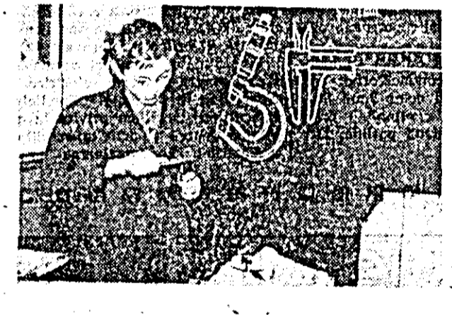
Doi instantaneu caracteristici care vorbesc despre activitatea ce se depune la Școala generală nr. 14 din municipiul nostru pentru educarea elevilor în spiritul muncii, al activității tehnico-productive, una din sarcinile trasate prin documentul de excepțională însemnătate elaborat de secretarul general al Partidului Comunist Român, privind educația comunistă.

În 14 octombrie a.c. Medeleanu, critic de la Casa Corpului de arte plastice. În cadrul manifestărilor, vorbitorii au insistat în special asupra rolului operelor de artă literară, muzicale, plastice — în procesul educației elevilor și al viitorilor constructori ai societății noastre socialiste. În vederea educării gustului pentru frumos la elevii a reșeit cu pregnanță, ca o concluzie a acestei manifestări, organizată tocmai cu scopul formării și educării multilaterale a elevilor și al viitorilor constructori ai societății noastre socialiste. Gama variată a posibilităților diriginților GEORGE MANEA