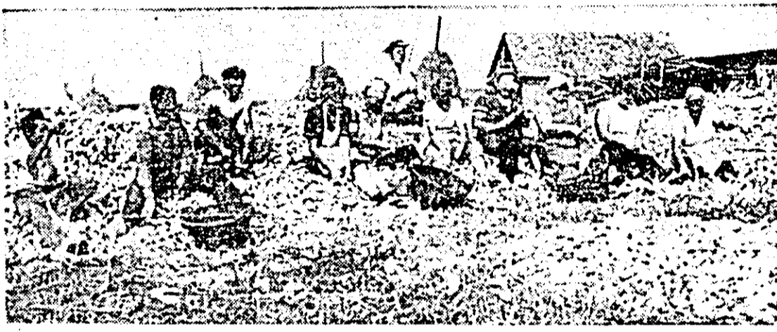
Porumbul recoltat mecanic la ferma nr. 3 a C.A.P. Lipova, este depănușat operativ.

Ritmul de lucru a crescut la arături pentru însămînțări, astfel că ele s-au executat pe 81 la sută din suprafața planificată. Paralel s-a pregătit terenul pe 237 ha lucrându-se în schimb prelungit și schimbul II cu A-1900-A. De remarcat că la ară-