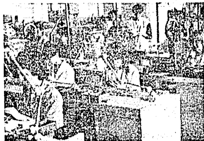
Cu rezultate bune în întrecerea socialistă se prezintă și secția montaj a Întreprinderii de orologerie industrială.

În perioada trecută de începutul anului, în privința modernizării tehnologiilor de fabricație. Menționând că, pe opt luni, au fost implementate în producție 137 tehnologii noi și modernizate, remarcăm din rândul acestora tehnologia de realizare a angrenajelor melcate de precizie și de puteri mari, tehnologia de prelucrare, prin procedee neconvenționale, a camelor plane de filetare, tehnologia de placare a săniștilor (la strungurile SU 560 CNC, SN 601, SF 400 CNC) cu rășini epoxidice și altele. Totodată, în perioada menționată, au fost elaborate și 34 de tehnologii de prelucrare a produselor pentru uzul beneficiarilor mașinilor-unelte realizate la IMUA — tehnologii care, la fel ca toate tehnologiile noi și modernizate introduse în acest an în producția Întreprinderii, asigură importanța sporului de productivitate a muncii și de calitate.