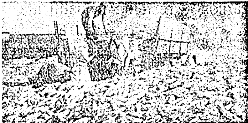
Recolta de porumb e bogată. Mecanizatorii și muncitorii de la I.A.S. Ulviניș de-abia prîdăsc cu transportul știuleților.

— Ce, damneala vrei să camperi prețuri sau ardeți?