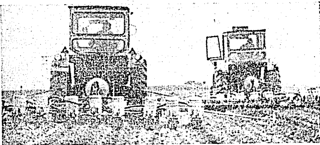
Tinerii mecanizatori pe ogoarele C.A.P. Secusigiu.

Majoritatea tinerilor din această organizație U.T.C. sînt mecanizatori care au convins că meseria lor este potrivită pentru tinerii zilelor noastre, cerind înalte cunoștințe tehnice, multă precizie, muncă în echipă. La aceste calități aspiră orice tânăr lucrător al ogorilor din Secusigiu, pentru că nu este ușor să dovedești că meriți titlul de „Erou al Noii Revoluții Agrare”.