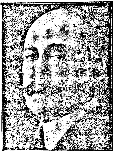
BADENI MIKSA HERCEG

Berlinből jelentik: Miksa badeni herceg ma Konstanzban meghalt. Hosszu ideje már súlyos betegen feküdt a német császárság utolsó kancellára, a kinek állapota a legutóbbi napokban — miként az Aradi Közlöny jelentette — válságosra fordult. Az orvosok mindent elkövettek, hogy a halálos beteg herceg életét meg-