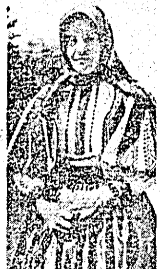
Din frumusețea portului popular de pe Valea Troaşului.