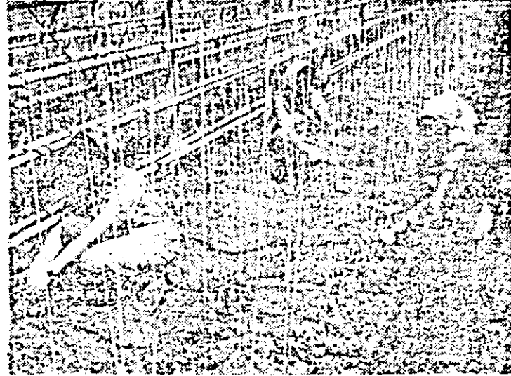
S.C.P.L. Aradul Nou. Imagine de la lucrările de întreținere a tomatelor timpurii.

nizare, rutieristii și încadrății de la sectorul anexe — dovadă a interesului crescînd al felnecanilor pentru munca câmpului. De altfel, la sfecla de zahăr se pot obține câștiguri mari în bani și în produse dacă se realizează producția planificată și acest lucru îl știu și oamenii. Iată de ce, l-am întrebat pe președintele ce perspective întrevede în legătură cu îndeplinirea planului. — Avem sarcina să obținem o producție de 40 tone la hectar, ne spune el, iar convingerea mea este că putem îndeplini acest obiectiv. Argumentele noastre constau în Ș. T. ALEXANDRU (Cont. în pag. a II-a)