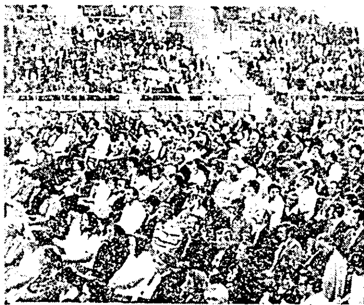
Imagine din sala conferinței.

Volumul investițiilor va fi de peste 13 miliarde lei din care 35,3 la sută pentru dezvoltarea industriei, 20 la sută