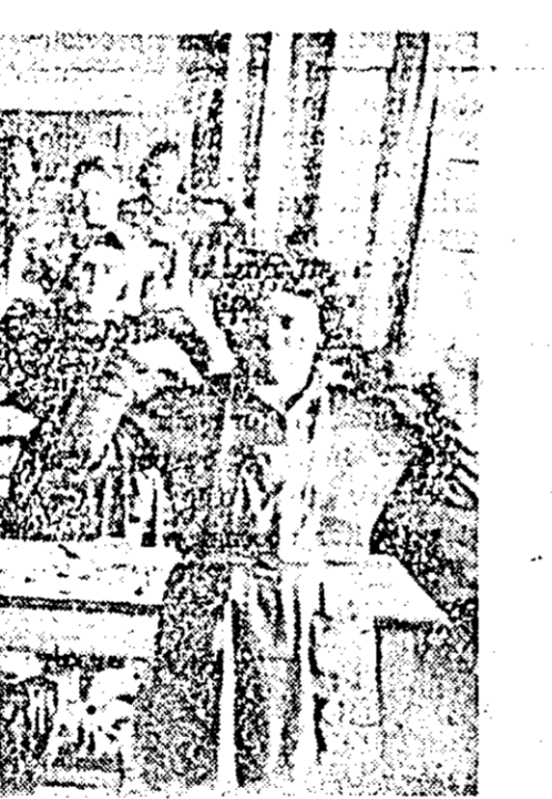
Aspect din timpul executării gimnasticii de producție la IPMS "Gravura".