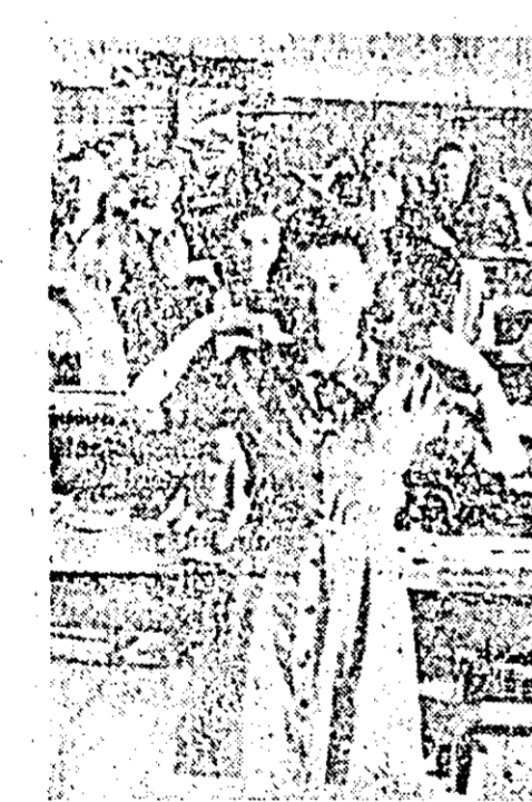
Aspect din timpul executării gimnasticii de producție la IPMS "Gravura".

și în mijlocul acestor evenimente, istorice pentru patria sovietică, se clocesc caractere diferite, se conturează sentimente de dragoste, asistăm la momente de lașitate a unor oameni demascați atunci cînd sînt puși în situația de a stabili concordanța între vorbe și fapte. Admirabile figuri de comuniști — aviatorul Konovalov, alături de viteazul și înfăcăratul corpondat de război, cu numele de Trolan, acest "simplu miserabil fără de partid", cum se intitulează el însuși, estoniană Linda — prieteni ei, care sub masa unei cochete superfluate știe să se sacrifice pen-