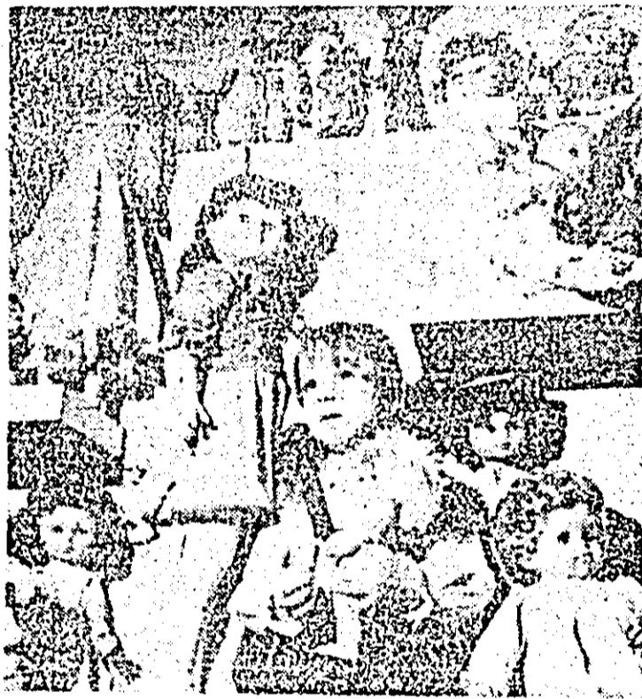
La „Arădeanca”, în lumea minunată a păpușilor.

Gastronomii apreciază carnea gustoasă a crabilor. Întă însă că și carapacea lor urmează să fie folosită în viitorul apropiat în medicină. Potrivit unui chimist din Delaware (SUA), carapacea crabilor conține chitină, un hidrat de carbon foarte asemănător cu celuloza și care are numeroase aplicații biologice. Se pare că de această nouă materie primă se interesează o firmă japoneză de industrie textilă, care o folosește în prezent la fabricarea unor fire pentru suturi chirurgicale. Acestea prezintă mai multe avantaje decât materialele sintetice: nu provoacă alergii, se resorb rapid în organism și activează procesul de cicatrizare. Aceste noi fibre chirurgicale sînt în prezent testate, urmînd ca în viitorul apropiat să fie comercializate, precizează „Sciences et Avenir”.