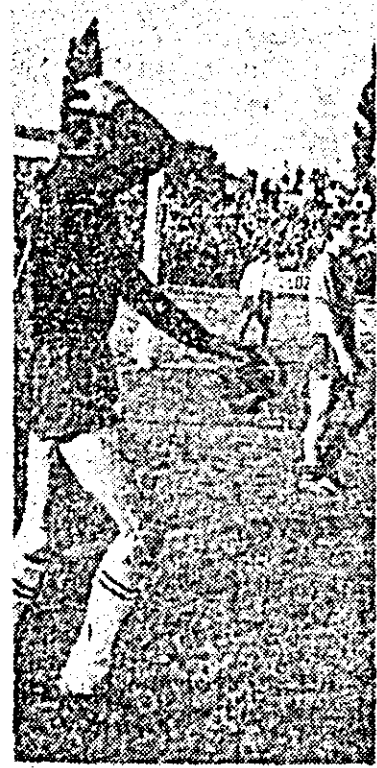
Haidu după 2-2.