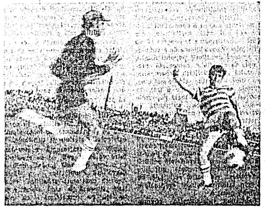
...Broșovski înscrie golul egalizator.