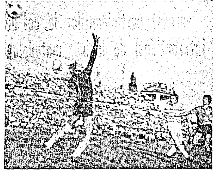
Domide înscrie primul gol pentru UTA...