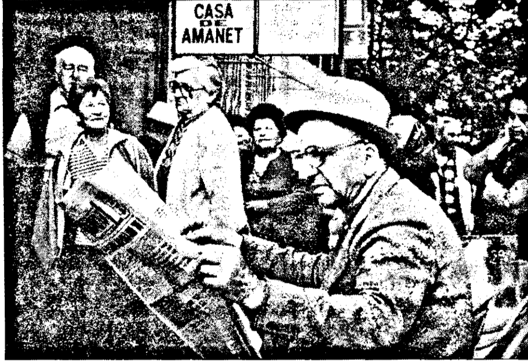
Cozi la amanetarea...grâjilor (?)

Cine erau și ce căutau? Cum cine? Securitatea era