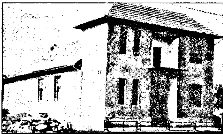
Căminul cultural din Cîl, un loc „uitat” de administrație.